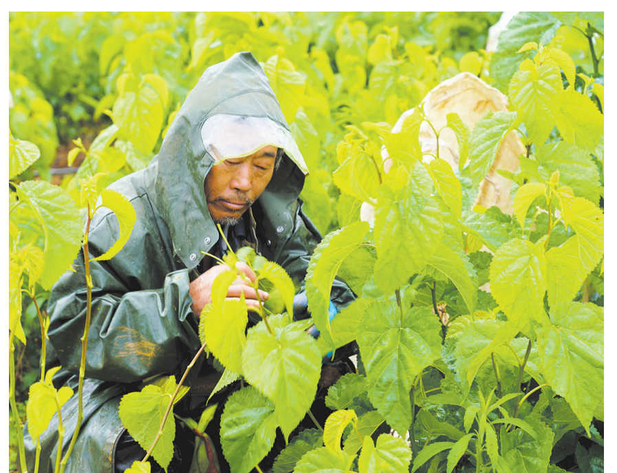
祥云县云南驿镇棕榈村工人在桑地采收桑叶。(摄于5月11日)

近年来,宾川县“葡萄、柑桔、石榴”老品牌持续发力,“浆果、脆蜜金柑、冰淇淋小番茄”新三品蓬勃发展的,全县果蔗种植面积达71.57万亩。其中,水果种植面积42.77万亩,水果产值达95.87亿元。良好的经济效益带动了数十万群众就业增收,截至2025年,全县共培育专业采果队、修剪队、装果队等“果业新农人”8.06万人,实现人均增收超2万元,特色农业真正成为全县富民强县的支柱。