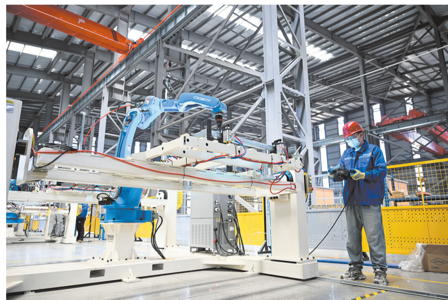
5月19日,工人在内蒙古赤峰市内蒙古梅捷新能源科技有限公司生产车间查看工业机器人运行情况。

作为传统工业城市,近年来,内蒙古赤峰市积极培育新产业,以跨境物流和绿色制造为引擎,推动经济结构从依赖传统资源向多元化增长转变,在搭建保税物流平台、培育新能源储能产业、融入国际供应链中逐步走出一条内陆城市转型升级的新路径,为经济发展注入新动能。