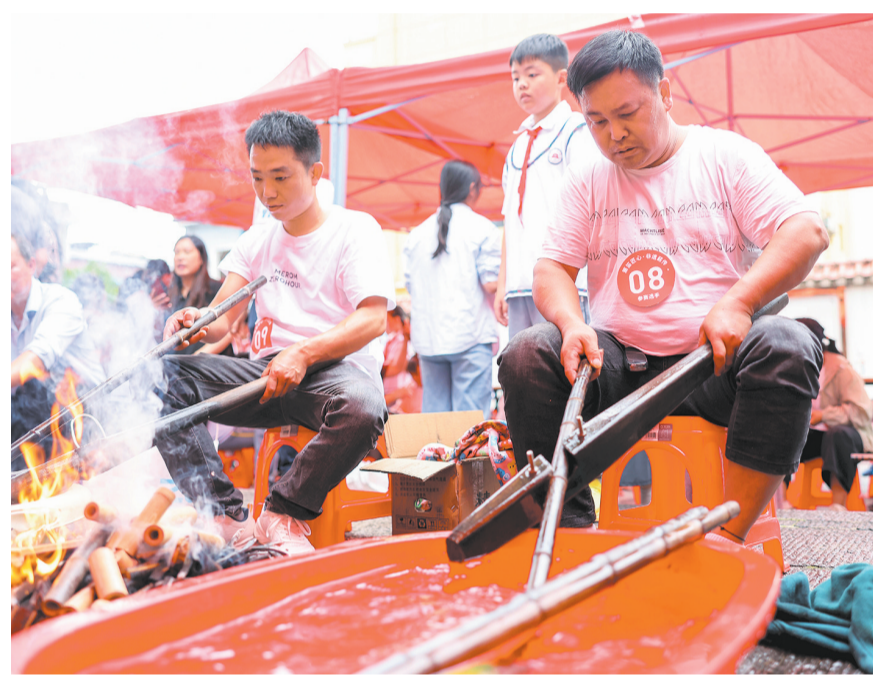
5月18日,在五屏侗族自治县箫笛博物馆,参赛选手现场制作箫笛。

5月18日是国际博物馆日,以“箫笛匠心·非遗薪传”为主题的箫笛制作工匠技能大赛在贵州省铜仁市玉屏侗族自治县箫笛博物馆举行,来自省内外外的箫笛制作师傅现场展示技艺。