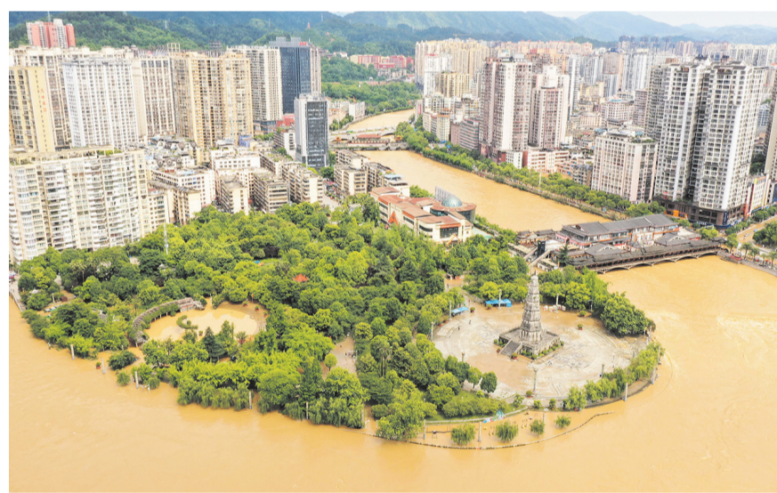
这是5月19日在贵州省都匀市拍摄的水位上涨的剑江河及受影响的沿河区域(无人机照片)。

5月18日6时至19日6时,贵州省都匀市遭遇特大暴雨。受特大暴雨及上游来水影响,剑江河水位快速上涨,19日6时起,都匀市城区河道迎来洪峰过境。