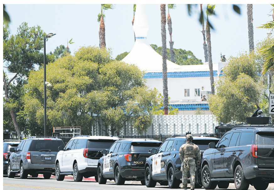
5月18日,在美国加利福尼亚州圣迭戈市,警察在发生枪击事件的伊斯兰中心附近警戒。

美国加利福尼亚州圣迭戈市警方18日说,当地一家伊斯兰中心当天发生枪击事件,造成包括两名嫌疑人在内的5人死亡。