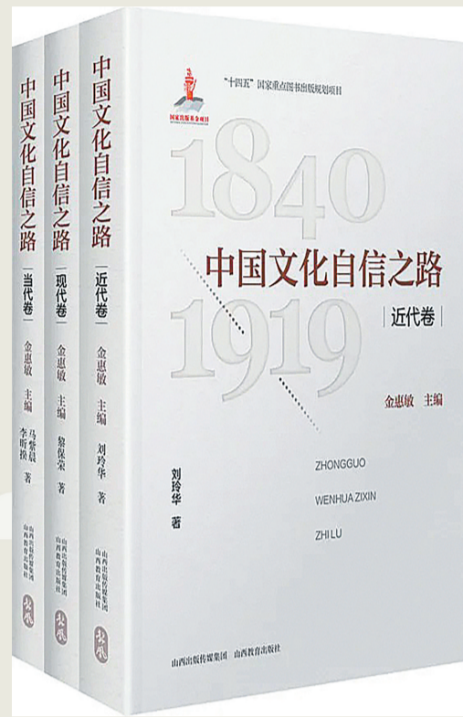
《中国文化自信之路》(三卷) 金惠敏 主编 山西教育出版社2025年5月出版

本书共三卷，是一部系统考察1840年以来中国文化自信思想重建历程的学术著作。该书以时间为线索，分阶段论述我国文化自信思想的曲折发展历程，分析了从鸦片战争到当代，仁人志士为振兴中华、提升民族文化自信、筑牢民族自信、坚持不懈，不断从中华优秀传统文化和中西文化比较中探寻理论依据，不断壮大中华民族精神力量的艰难历程，是一部高品质学术论著。