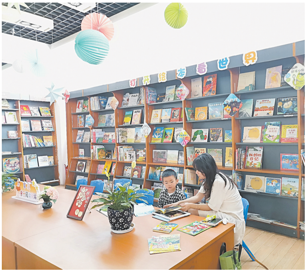
一对母子在新华书店云南省大理市泰安路店“家庭亲子阅读驿站”亲子阅读，沉浸在书香里。（摄于4月20日）

定时开放的阅览室、遍布校园的阅读角，让阅读融入培训日常，让书香浸润干部成长。参训学员在潜心中拓展视野、提升素养。下一步，大理市委党校将持续深耕书香校园建设，不断优化馆藏资源，完善服务保障措施，持续以书香涵养优良学风，以阅读赋能干部成长。