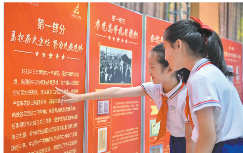
5月19日，北京市海淀区羊坊店第四小学的学生在观看抗战文物展。5月19日，由北京市教育委员会指导，中国人民抗日战争纪念馆和北京教育融媒体中心联合主办的2026“中流砥柱——中国共产党抗战文物展”校园巡展活动开幕式在北京城市学院航天城校区举行。本次校园巡展活动将陆续走进北京市22所大中小学。