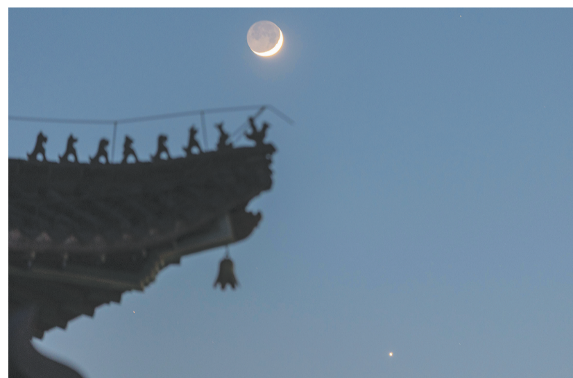
这是5月19日在黑龙江省佳木斯市拍摄的金星合月。5月19日，天宇上演金星合月。