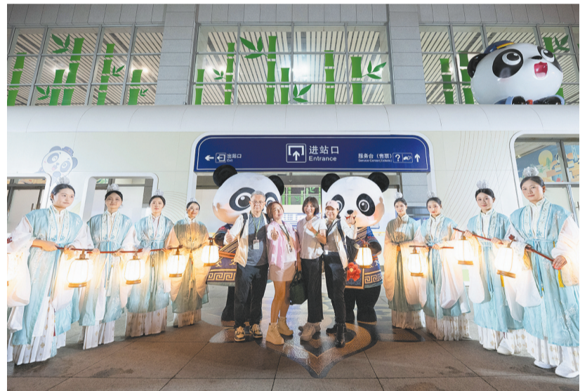
5月19日0时40分，首列“蜀锦宋韵”主题旅游列车——“熊猫专列·锦绣天府号”在四川成都安靖站旅客首发，满载92名旅客驶向新疆，开启为期16天的南北疆全景之旅。该趟旅游列车采用昼游夜行模式，串联乌鲁木齐、天山天池、喀纳斯、禾木、赛里木湖、那拉提、喀什、帕米尔高原、吐鲁番等核心目的地，覆盖高原湖泊、草原湿地、丝路古城、戈壁绿洲等景观。