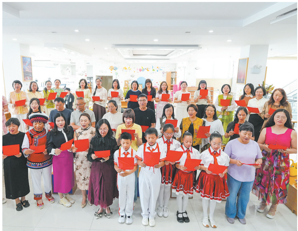
参加读书活动的全体书友集体诵《强国有我》。

据悉，下一步，祥云县社科联将以此次社科普及宣传周为契机，持续开展形式多样、贴近群众的全民阅读和社科普及活动，让书香浸润城乡每一个角落，让理论知识深入人心，引导广大干部群众在阅读中汲取智慧和力量，为谱写祥云高质量发展新篇章筑牢精神根基。