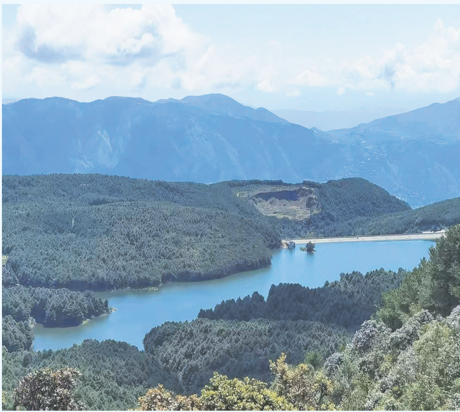
茂密森林环绕的洱源县罗坪山凤羽河水库。(摄于5月24日) 近年来,洱源县加强对洱海源头罗坪山森林的保护,同时,鼓励洱海流域各乡镇开展植树造林,让洱海水源地的水质逐年得到提升。