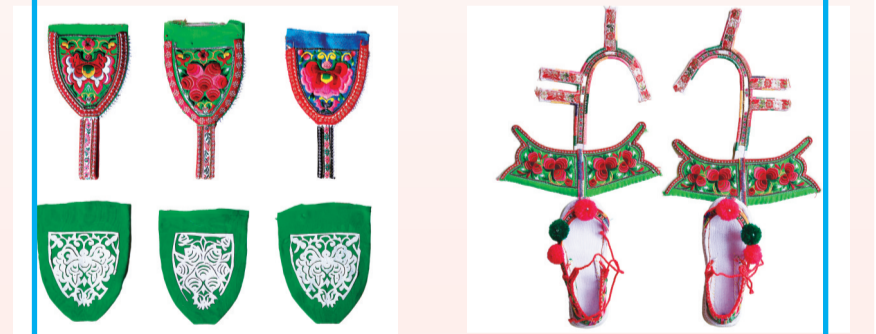
白族妇女围裙把手刺绣成品。