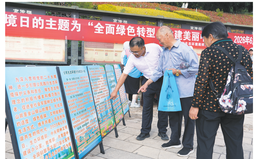
大理州生态环境局祥云分局干部职工向群众讲解环保知识。(摄于6月5日)

当日，祥云县2026年六五环境日宣传活动在县城龙翔公园开展，活动通过设置环保科普展台、悬挂主题横幅、发放宣传资料等形式，面向过往群众普及绿色低碳与生态保护知识，推动环保理念从“口号”走进日常。