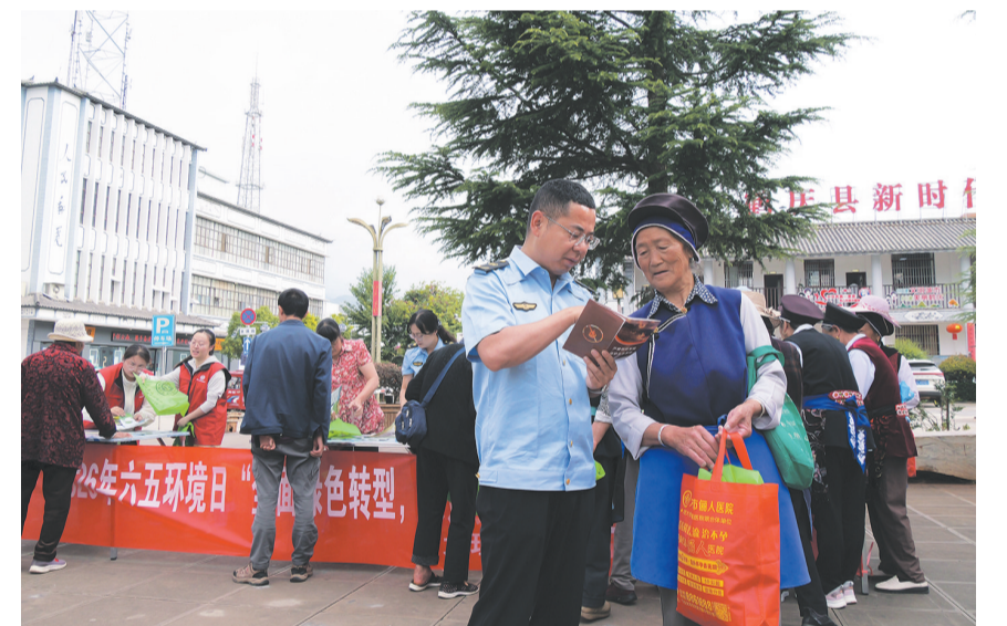
大理州生态环境局鹤庆分局在文庙公园向群众宣讲环保常识。(摄于6月5日)

一条建议入国法，彰显民意温度；一轮监督护公正，筑牢法治防线；一场普法润民心，厚植法治土壤。下一步，云龙县人大常委会将持续夯实社情民意收集平台、依法履职阵地，不断丰富全过程人民民主在基层的实践形式，让人民当家作主在基层法治实践中焕发更强活力、绽放更亮光彩。