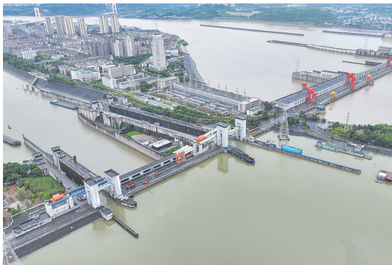
6月8日拍摄的三峡水运新通道工程葛洲坝航运扩能施工现场。

运行制约和监督机制,设立监督举报电话,对招生工作全领域各环节进行监督。同时,邀请多名军校招生形象代言人面对面为考生答疑解惑、交流经验,并通过报纸、电视、网络等多种渠道发布官方招生公告、公开招生信息、更新招生动态,及时回应考生和家长关切。