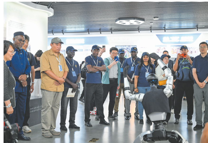
6月8日,参访代表在天津轻工职业技术学院观看机器人表演。

近日,由国务院新闻办公室主办的“人权行动看中国·2026”主题参访活动天津日正式启动。多国代表走进港口、社区、学校,近距离感受中国发展成就带给群众的获得感与幸福感。