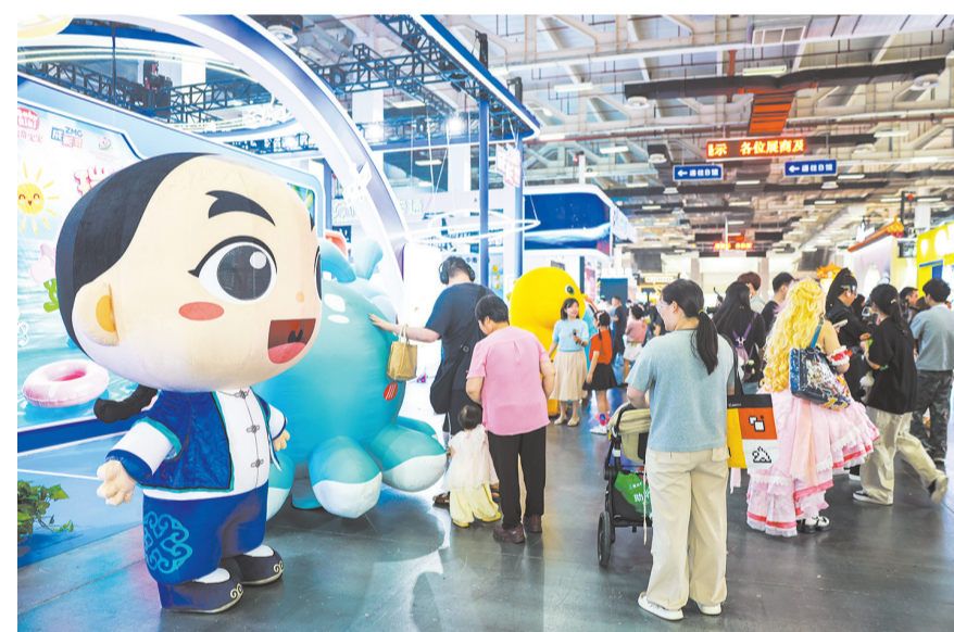
6月17日，观众在动漫节主会场参观动漫品牌展示交流互动。6月17日，第二十二届中国国际动漫节在浙江省杭州市开幕。本届动漫节以“国漫杭州论剑 共绘动漫新篇”为年度口号，主会场设在杭州白马湖国际会展中心，并在杭州市各地设置8个分会场。