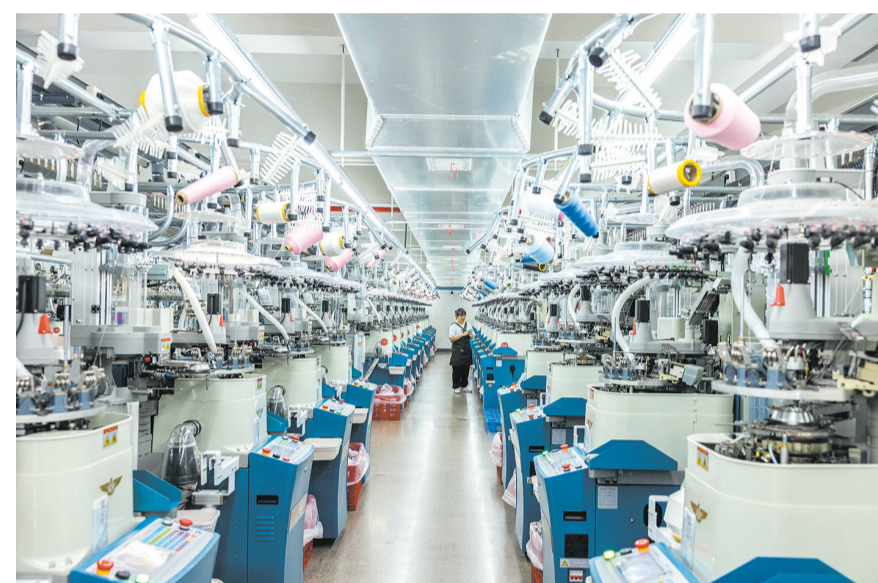
6月15日，位于浙江省诸暨市大唐街道的浙江棉竹屋纺织科技有限公司智能数字车间内，工人在织造翻领智能一体袜机前抽样检查。

浙江省立足数字经济先发优势，以数智赋能推动传统产业焕新升级，通过数字化、智能化改造升级激发传统制造新活力，为制造业高质量发展注入新动能。围绕加快传统产业焕新升级，浙江省“十五五”规划纲要提出，深化“腾笼换鸟、凤凰涅槃”攻坚行动，推进传统产业技术改造、设备更新和生态化改造，增强质量技术基础能力，推动传统产业内生裂变和转型发展。