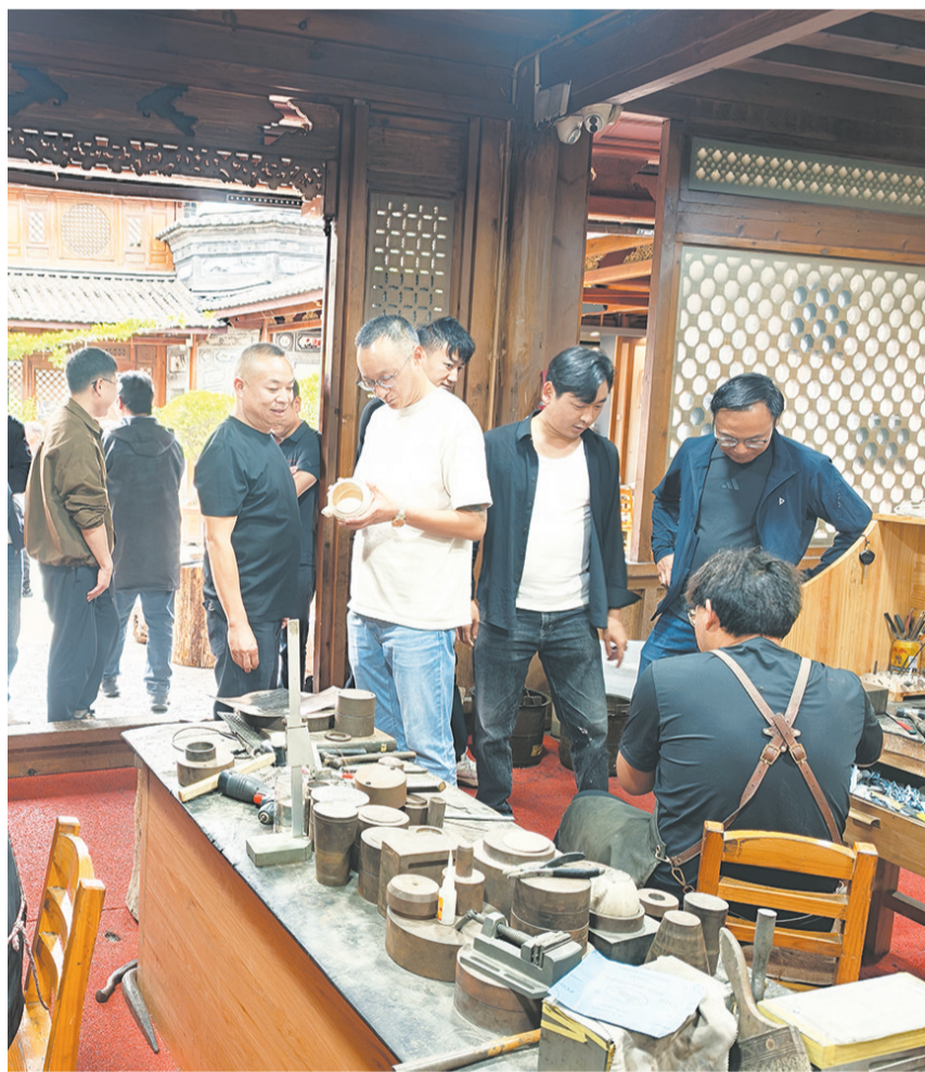
参会人员参观体验银器锻制技艺。(摄于6月15日)

本报讯(通讯员 张珍 文 / 图) 为充分发挥乡土文化能人、非物质文化遗产代表性传承人在文脉传承、产业发展、乡村治理中的示范带动作用，持续深化“乡土文化能人助村”行动，6月15日，鹤庆县草海镇新华村开展了“乡土文化能人助村”银器锻制技艺交流体验文明实践活动。