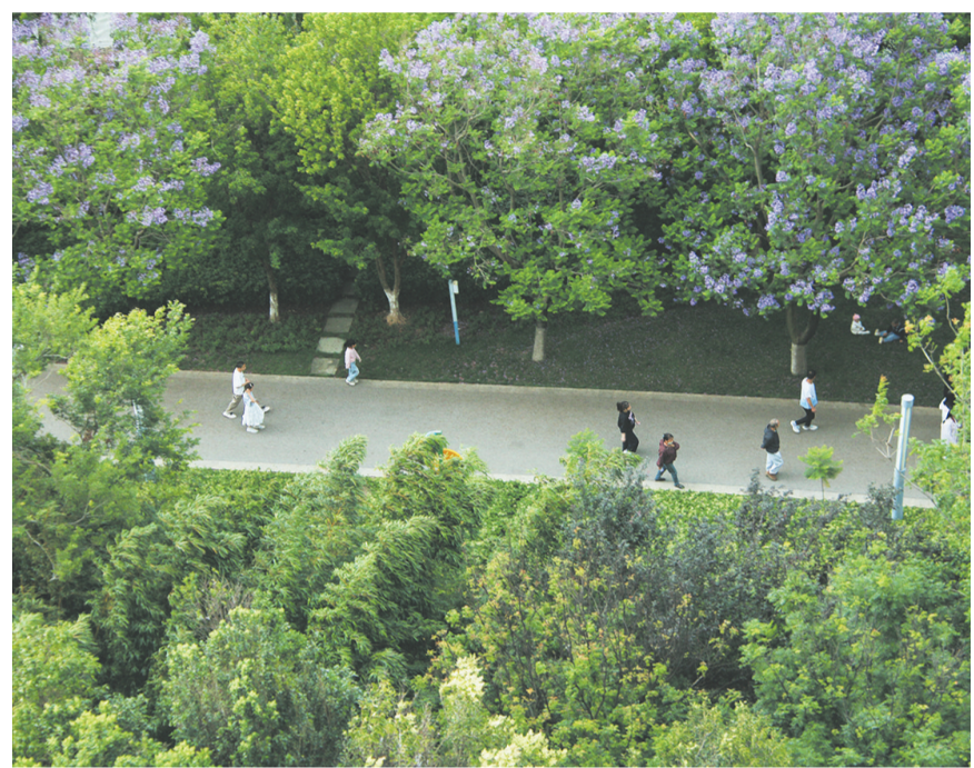
市民在祥云县玉波湿地公园散步健身，尽享运动乐趣。(摄于6月13日)

近年来，祥云县持续深耕体育惠民工程，不断完善城乡公共体育配套设施，优化全民健身公共服务体系，有效盘活体育资源，助力群众体育事业高质量发展。