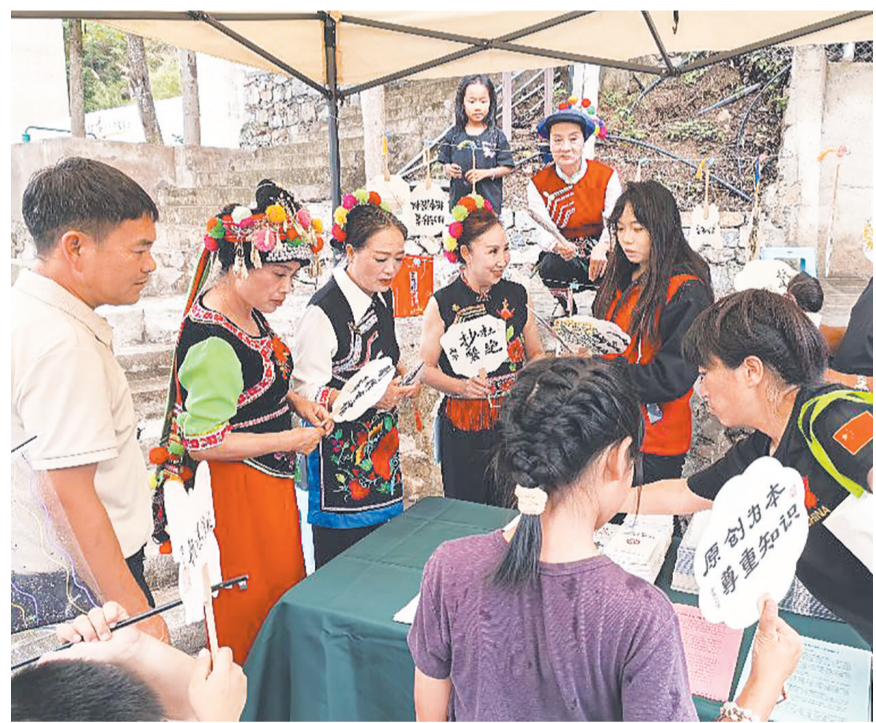
在澜沧江边猛龙渡景点，志愿者在开展著作权法宣传。(摄于6月13日)

近年来，南涧县细化普法宣传措施，抓实普法宣传工作，各部门依据责任清单结合自身行业特点，开展法律知识宣传多样化活动，将法律法规知识普及到大众心中，法治建设水平得到有效提升。