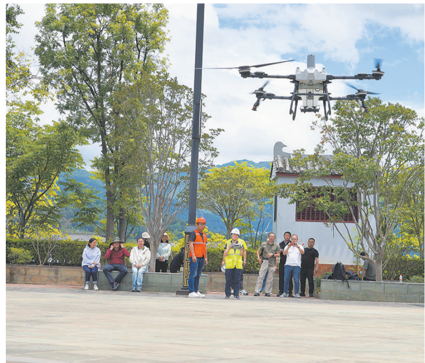
学员们在依次进行植保型无人机实操考试。(摄于6月12日)

6月10日至12日，云南省卫生健康委血吸虫病专家咨询委员会植保型无人机施药灭螺技术推广应用培训在巍山县举办。本次培训聚焦血吸虫病源头防控，针对传统人工灭螺效率低、风险高的痛点，系统传授无人机灭螺技术。