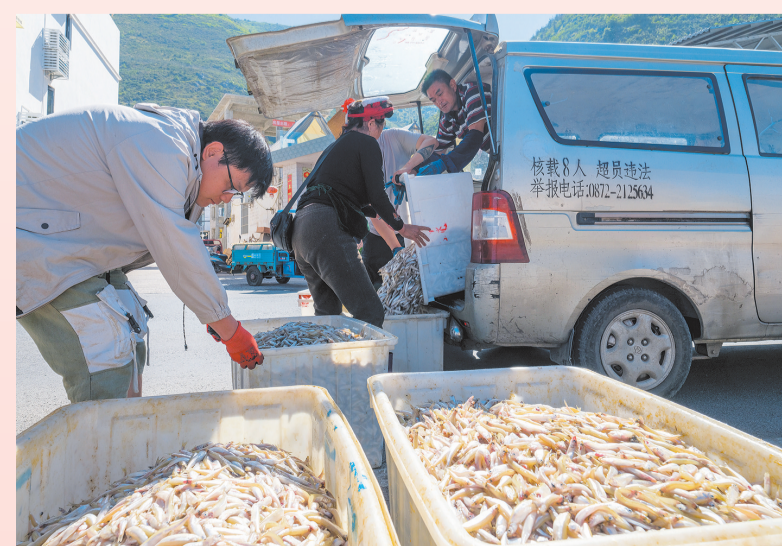
分拣好渔获后及时运往市场销售。