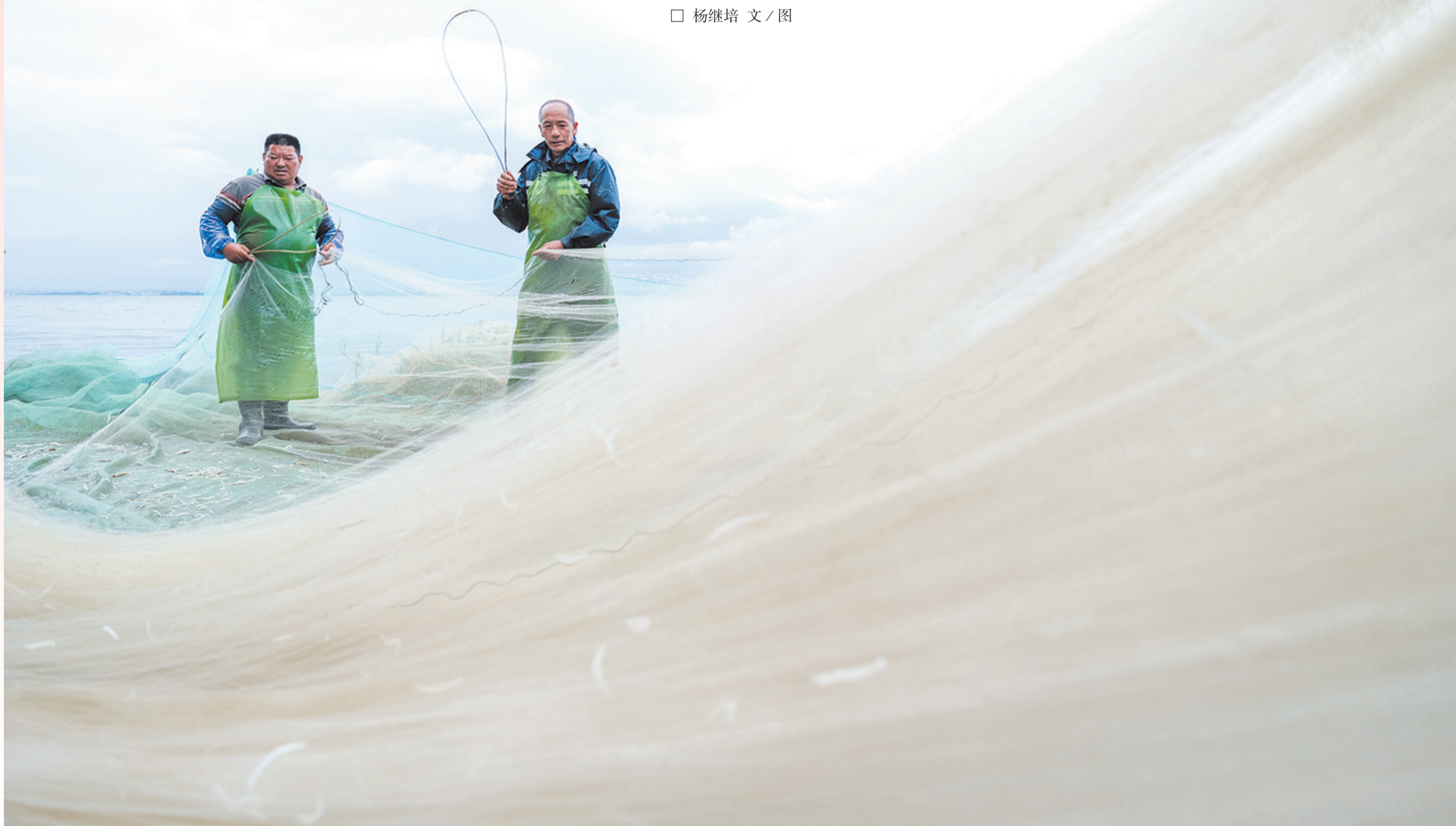
清晨，渔民上岸后及时拣拾渔获。

暮色四合，洱海之上渔灯点点，如繁星入海。每年洱海鱼类生态调控开海捕鱼期间，洱海渔民化身“生态卫士”，以科学捕捞守护母亲湖，在碧波间收获洱海生态保护与增收的双重馈赠。镜头下的每一幕，都镌刻着洱海保护与民生改善的共生密码。