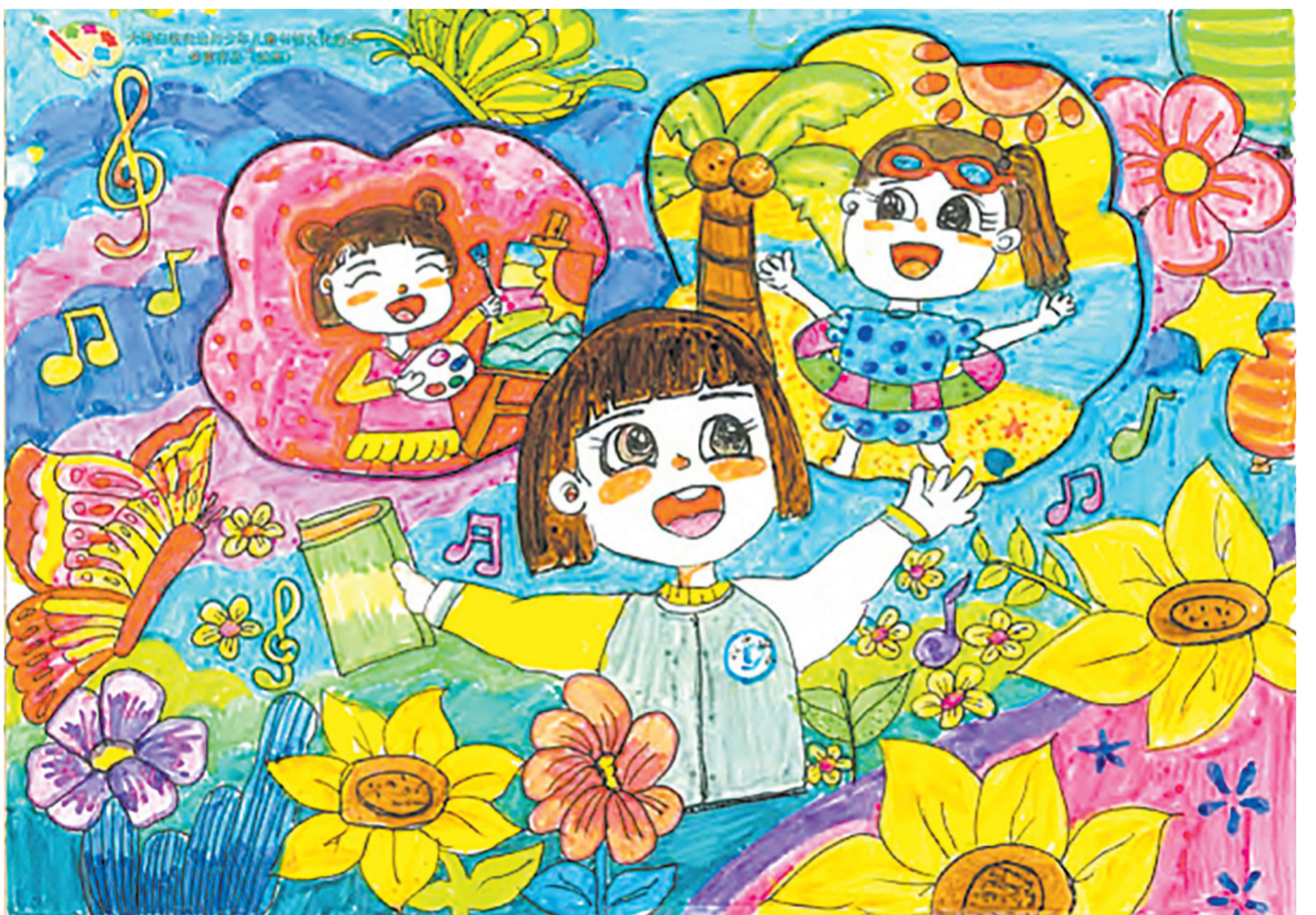
④ 祁思潼(大理市双德幼儿园) 大理州第十九届少年儿童书信文化比赛活动幼儿绘画比赛二等奖作品