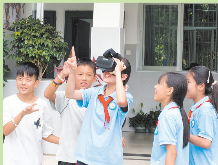
弥渡县科协科普大篷车驶入弥渡县牛街乡第一完全小学，孩子们近距离感受科学魅力。(摄于6月17日)

当镜头转向图书馆内景时，书架一排排延伸到画面深处，自习桌上摊开的书本和笔记本电脑整齐摆放，偶尔有大学生从镜头前低头走过——没有刻意安排的讲解词，也没有表演式的互动，屏幕里呈现的就是一所大学最日常的样子：红砖墙记录着岁月，民主湖倒映着天光，而穿行其间的每一个人都步履匆匆，朝着各自的目标赶路。这种