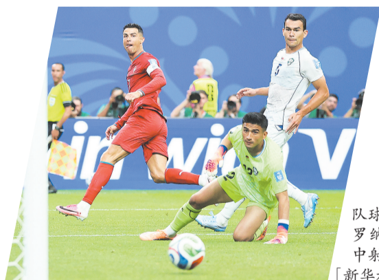
6月23日，葡萄牙队球员克里斯蒂亚诺·罗纳尔多(左)在比赛中射门得分。