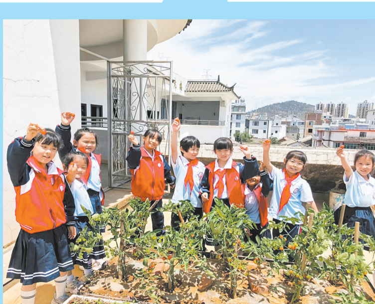
大理市凤仪镇石龙完小学生摘下自己亲手栽种收获的小番茄，脸上满是丰收的喜悦。(摄于6月16日)

为落实五育并举，深耕劳动教育，石龙完小开辟校园小农场，让孩子们在亲身劳作中感知种植的乐趣、收获劳动的成长，为校园生活添上了生动鲜活的劳动教育一课。