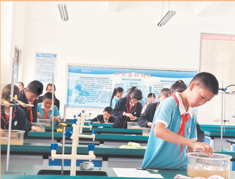
巍山县庙街镇管盘小学学生正在做科学实验。(摄于6月16日)

近年来，该校学校以实验课堂为载体，推动“学思用”融合，让学生在亲自动手操作、观察探究中培养科学思维，让素养教育落地在每一次动手实践里。