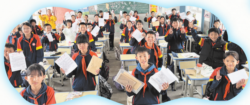
云龙县漕涧镇的孩子们收到来自重庆大学的信。(摄于6月11日)

从书信到视频连线，从短期支教到共建实践基地，这场跨越山海的教育接力，正在大山深处悄然改变着什么。正如一位重庆大学大学生在回信中所写：“那个你想去的广阔世界，藏在书本的字里行间。”对于漕涧镇的孩子来说，世界的轮廓，正通过这一封封信、一次次连线、一节课课堂，变得越来越清晰。