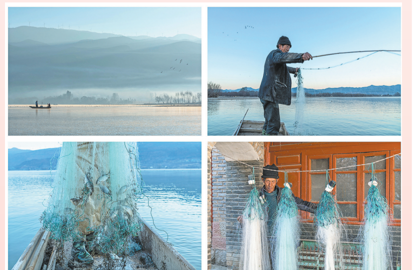
剑湖周边渔民现在仍然沿着传统的捕鱼方式。