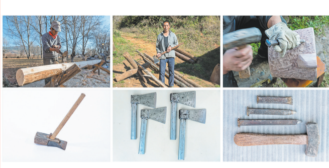
现在剑川木匠师傅使用铁锤、铁斧和石匠师傅使用铁制工具做活的工作场景。