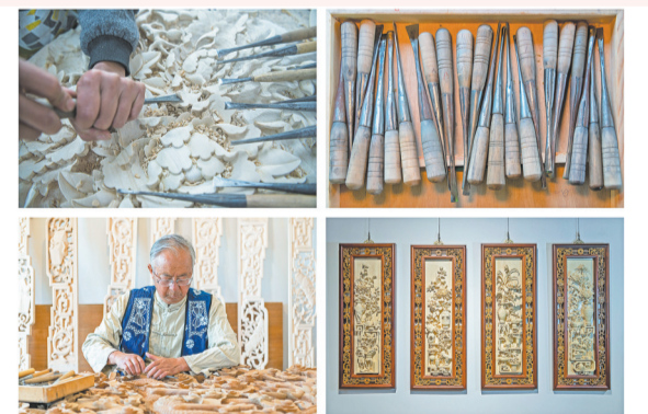
国家级非物质文化遗产代表性项目——剑川木雕。