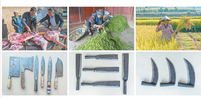
现在剑川百姓生活中使用杀猪刀、砍柴刀和镰刀的生活场景。