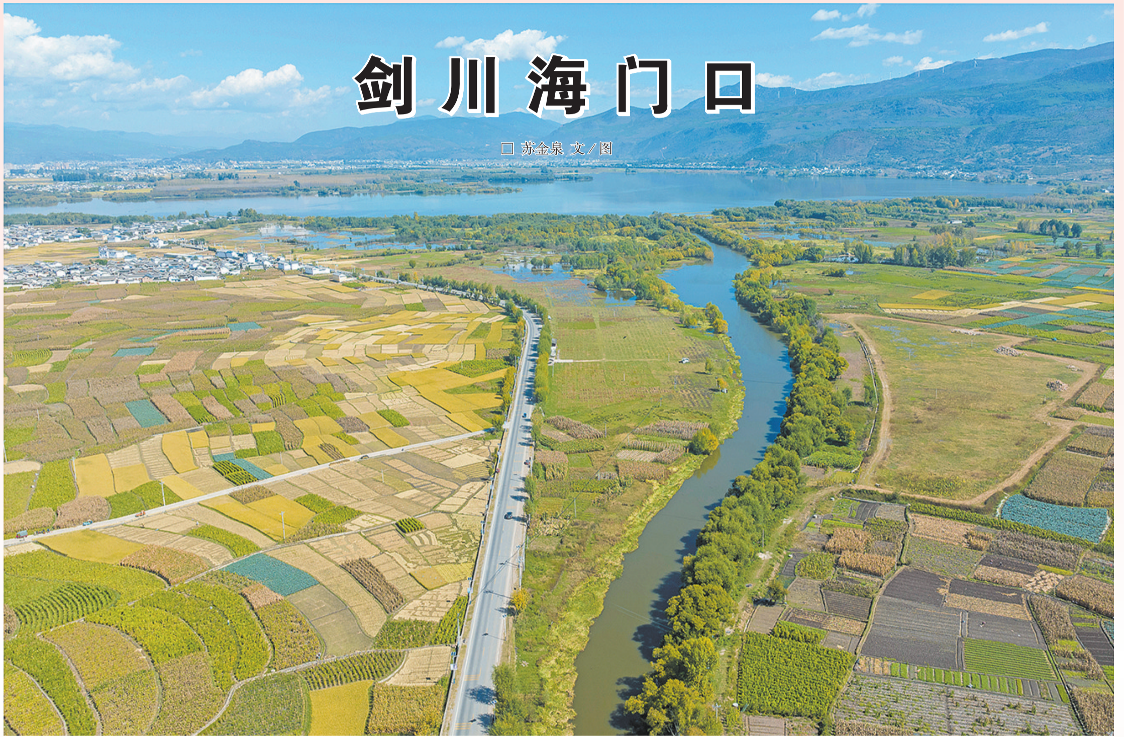
位于剑川坝子西南的海门口遗址鸟瞰图。

剑川，一个滇西小县城，因其特殊的地理位置、别具特色的地方文化而备受关注。要了解一个地方的文化，首先要从留下的文物开始，文物又要从考古说起。剑川地处大理州最北端，是进藏的要冲，坝子西靠金华山，坝子东南有一个被剑川人称之为母亲湖的剑湖，剑湖南端有一个出水口，叫海门口，湖水从海门口向南流出，经沙溪古镇的黑惠江，沿着苍山背面继续往南流去，汇入澜沧江，流至西双版纳出境后称为湄公河，最后归入太平洋。