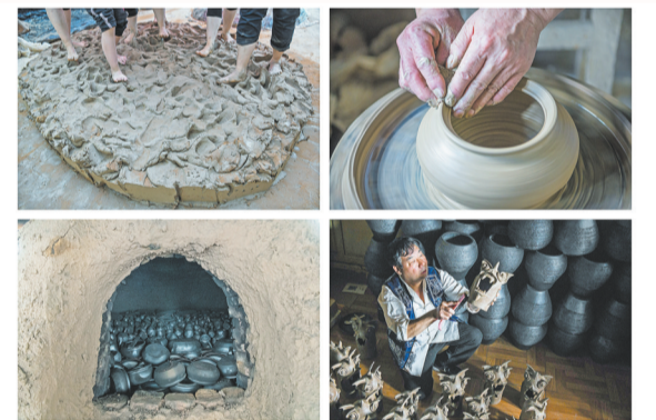
省级非物质文化遗产代表性项目——剑川陶器制作技艺。