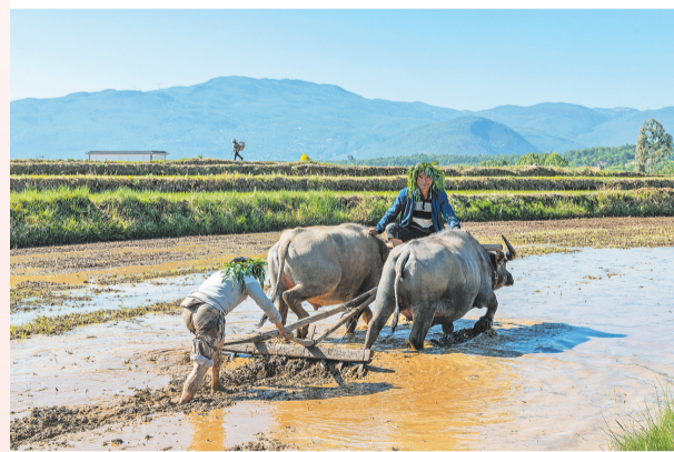
现在剑湖边仍能看到农户饲养黄牛的生活场景(上图)和“二牛抬杠”的耕作方式(下图)。