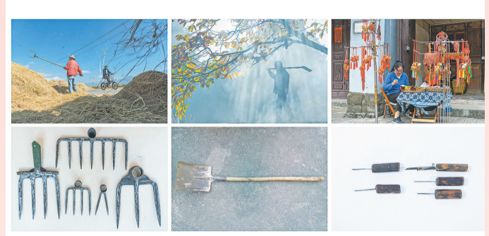
海门口旁沙沟尖村村民在生活中使用铁耙、铁铲的生活场景和使用铁制工具制作省级非物质文化遗产项目——白族布扎的生活场景。