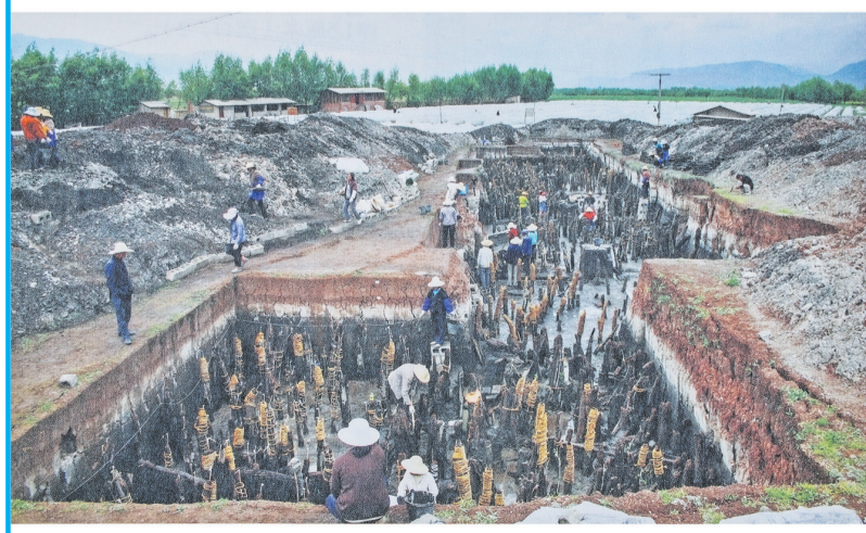
2008年海门口遗址第三次发掘区俯瞰图(左上图)和发掘区现场图(左下图)。2008年海门口遗址第三次发掘“杆栏式”建筑聚落遗址中带榫口的木构件、带榫口的木桩柱、井字型房子(右上图)。2008年海门口遗址第三次发掘的骨耜、石耜、铜耜(右下图、距今约3100—2400年)。(图片翻拍于云南民族出版社2010年出版的《中国剑川海门口遗址》)