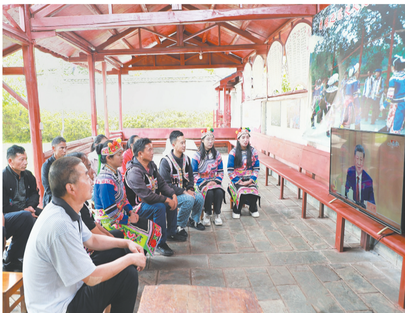
7月1日上午, 永平县龙街镇古富村“两委”班子成员、全体党员集中收听收看庆祝中国共产党成立105周年大会直播。