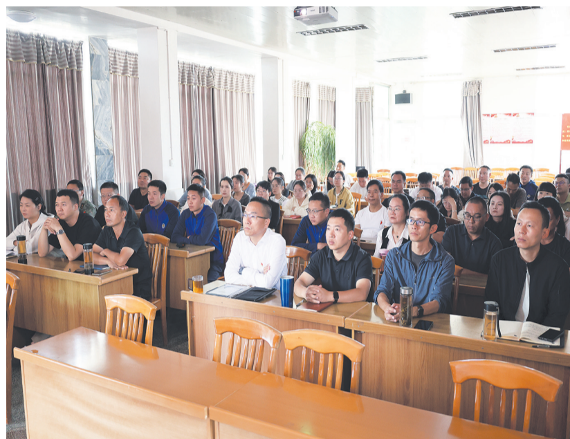
7月1日上午, 祥云县刘厂镇组织全体干部职工集中收听收看庆祝中国共产党成立105周年大会直播。