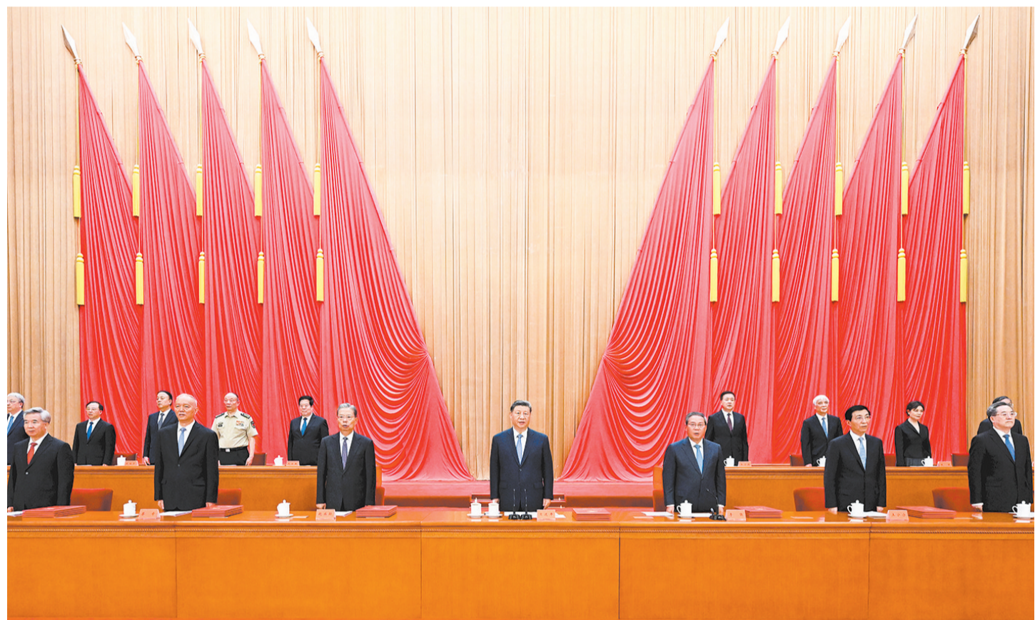
7月8日上午，国家科学技术奖励大会、中国科学院第二十二次院士大会和中国工程院第十八次院士大会、中国科学技术协会第十一次全国代表大会在北京人民大会堂隆重召开。中共中央总书记、国家主席、中央军委主席习近平出席大会并发表重要讲话。