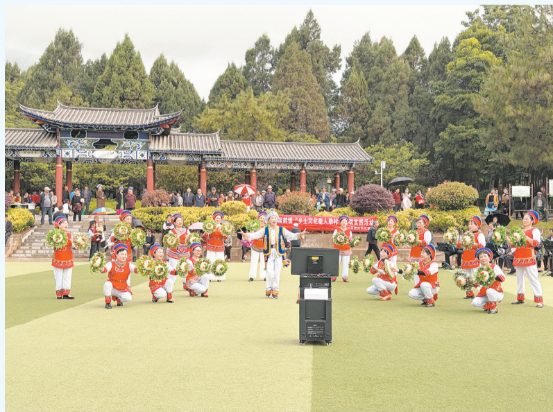
鹤庆县云鹤镇文峰社区文艺团队在为群众表演。(摄于6月12日) 近日，云鹤镇文峰社区组织本土土文化能人开展“文化惠民，乐享生活”惠民文艺演出活动。活动当天，现场气氛热烈，节目丰富多彩，贴近群众生活，还融入了文明新风和惠民政策宣传。 文艺展演活动以本土文化能人龚锦芳为核心引领，她深耕基层文艺多年，是当地文化活动的“带头人”，挖掘和改编了10余个群众喜闻乐见的文艺作品。