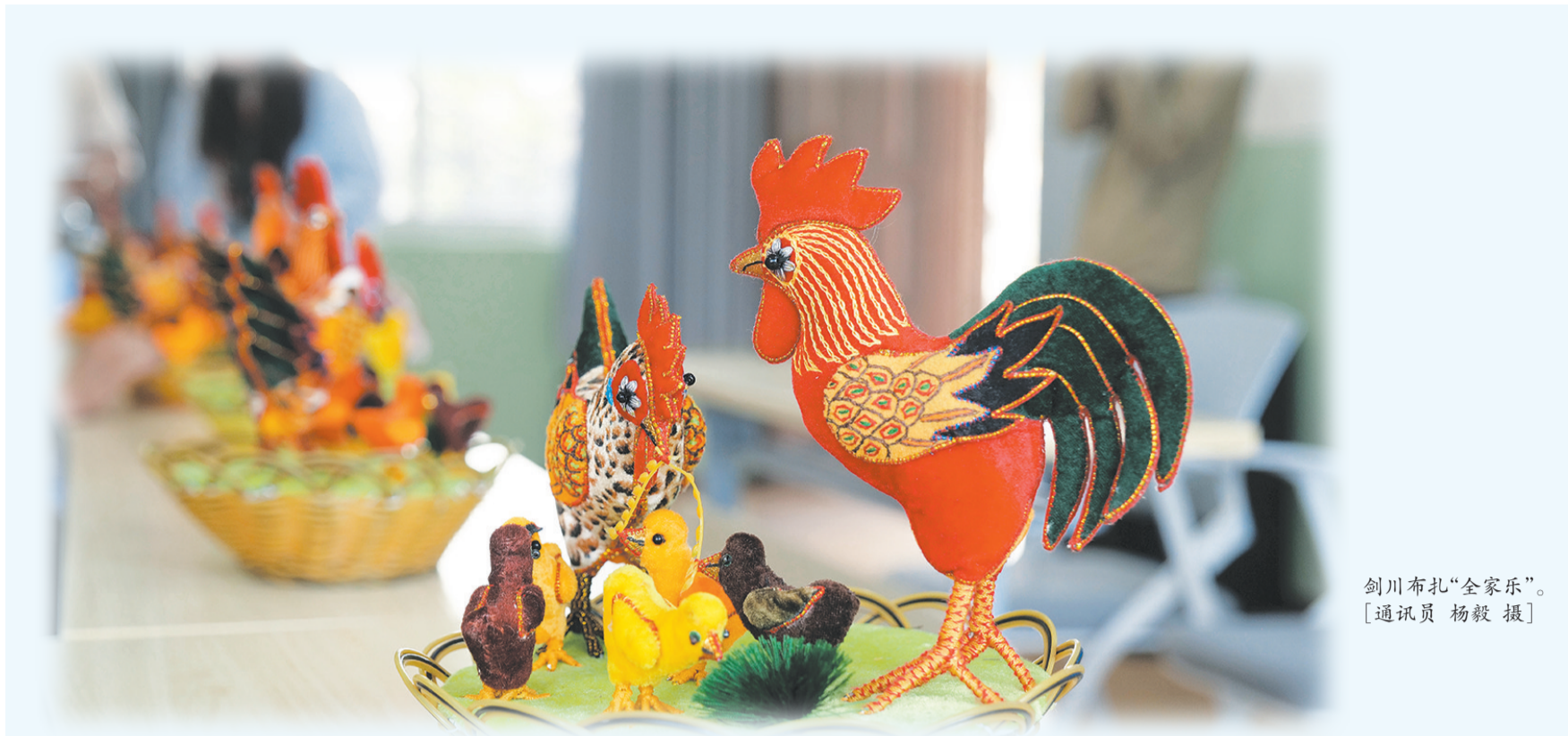
剑川布扎“全家乐”。