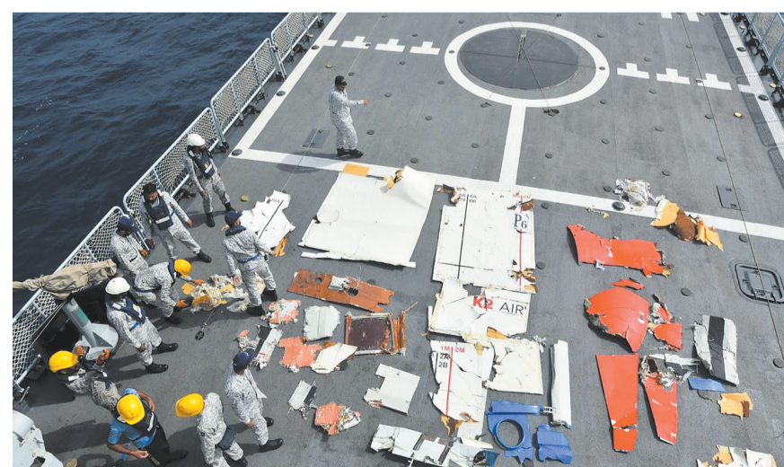
这是7月8日在巴基斯坦西南部俾路支省奥尔马拉以南海域拍摄的失联货机残骸。巴基斯坦机场管理局8日在社交媒体发文说,在经历12小时搜救后,巴方发现并确认7日晚失联的波音737货机残骸...