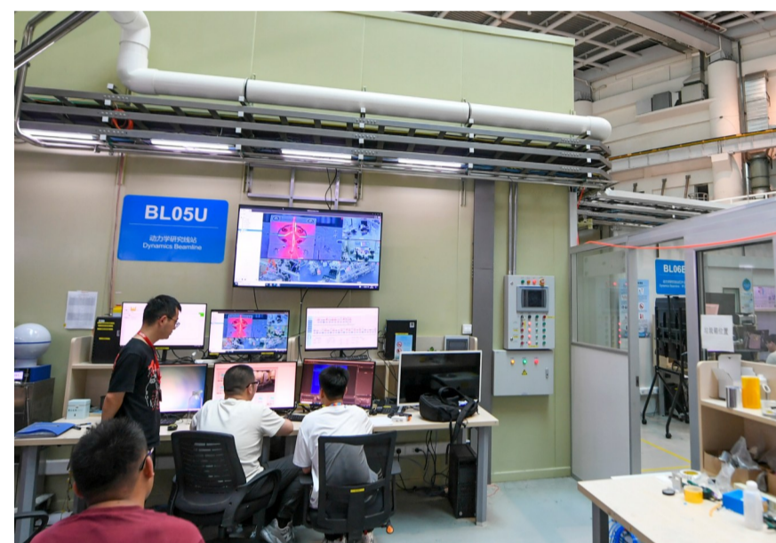
7月8日,工作人员在位于上海浦东的上海光源内部动力学研究线站开展科研工作。目前,在沪已建成运行的10家国家重大科技基础设施全部实现向全社会开放...