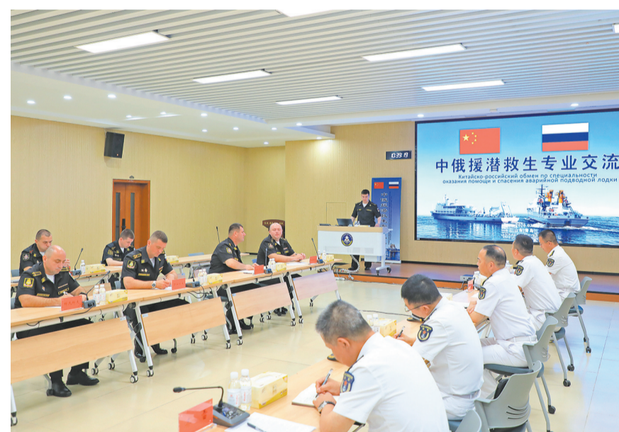
参加中俄“海上联合-2026”联合演习的双方官兵开展援潜救生专业交流(7月7日摄)。中俄“海上联合-2026”联合演习岸基筹划阶段圆满完成,9日正式进入海上演练阶段...