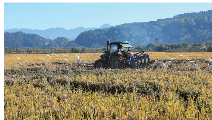
12月7日，云南省腾冲市和顺镇大庄村农民驾驶农机翻耕稻田，准备种植冬季马铃薯。当日是大雪节气，各地农民抢抓农时，有序开展冬季农业生产。

度制导控制。验证内容包括冷气反作用控制系统与栅格舵的复合控制策略，以及相应制导算法的正确性。本次试验进一步夯实了我国在液氧甲烷可回收运载火箭技术路线上的工程实践基础，为我国实现一级回收探索了可行路径。