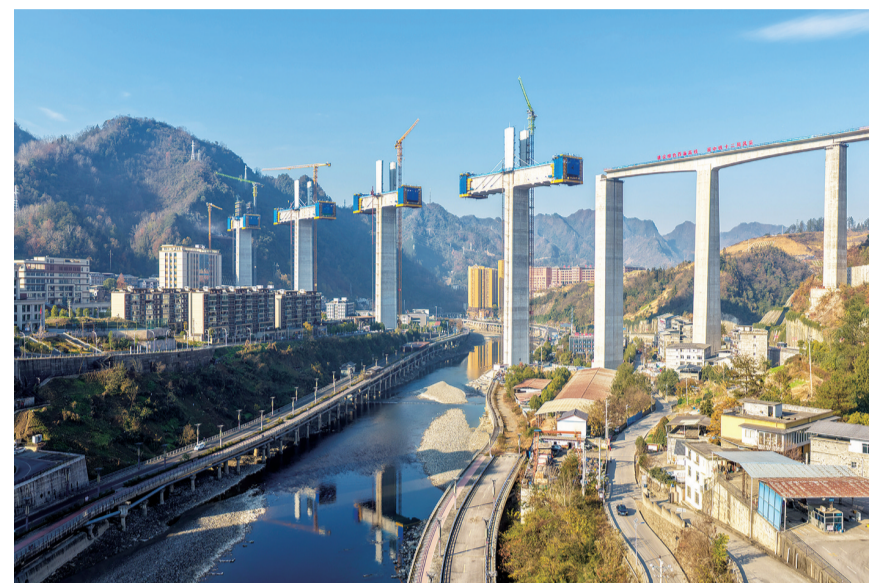
这是12月7日拍摄的西渝高铁任河特大桥建设现场(无人机照片)。12月7日，由中铁十二局承建的西渝高铁城口任河特大桥塔柱施工任务全部完成，全桥施工进度完成近七成，为西渝高铁全线按期贯通奠定了基础。城口任河特大桥位于重庆市城口县境内，为西渝高铁康渝段重难点工程，全长1180.52米。西渝高铁是我国“八纵八横”高铁网北京至昆明的京昆通道和包头、银川至海口的(包)海通道的重要组成部分，线路全长739公里，设计时速350公里。

新华社北京12月7日电 12月6日22时许，G30连霍高速K3906公里附近(距新疆鄯善地区乌苏市区约70公里)，发生多车追尾相撞事故，造成9人死亡、7人受伤。接报后，应急管理部有关负责人立即作出部署，要求科学组织救援，防止发生次生事故；全力救治伤员，最大限度减少人员伤亡；尽快查明原因，举一反三，坚决避免类似事故发生。应急管理部已派出工作组和相关专家赶赴现场，指导救援处置，协助救治受伤人员。