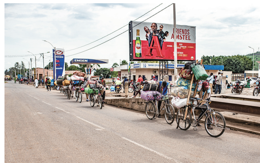
这是12月5日在卢旺达布加拉马拍摄的因战火逃离家乡的刚果(金)的民众。近日，刚果(金)军方与反政府武装“M23运动”在位于刚果(金)东部的南基伍省多地爆发激烈战火，造成大量平民伤亡和流离失所。