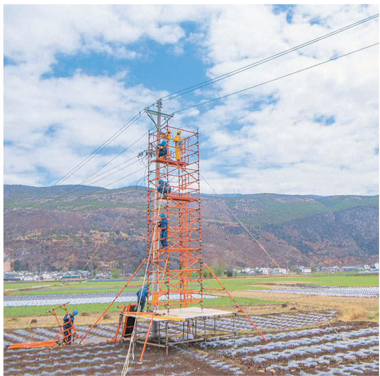
南方电网云南大理剑川供电局带电作业班免费为辖区内农业科技有限公司搭接线路引流。(摄于3月22日)

南涧县素有“茶叶之乡”的美称,是大理州主要的产茶基地,也是云南省茶叶重点基地县之一。近年来,南涧供电局立足南涧县“绿美茶区,农旅融合发展示范区”发展定位,主动对接茶产业发展需求,构建从种植到加工的全产业链电力服务体系。为保障春茶生产期间的电力供应,在大力实施电网改造升级的同时,积极优化服务流程,成立茶产业服务专班,开通春茶用电绿色通道,提供“一对一”用电指导;组建24小时值守的应急抢修队伍,实行人巡机巡立体巡检模式,开展春季驻点值守,以充足电力、优质服务护航茶产业提质增效,助力乡村全面振兴。