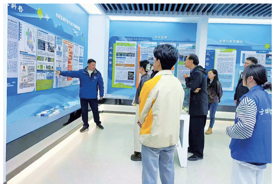
大理市太和街道榆华社区党总支联合多家共建单位开展“探水文奥秘 护苍洱安澜”主题宣传教育活动。(摄于3月30日)

榆华社区依托“党建综合体”平台,探索“党建+治理”模式,资源共享、阵地共用,紧密团结辖区机关单位、企业、新业态群体等,凝聚共治合力。