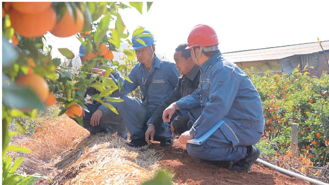
宾川供电局大营供电所工作人员到田间向村民进行回访调查。(摄于3月19日)

近年来,宾川供电局始终坚守为民初心、勇担保供使命,持续做强电网支撑、做优供电服务、做实民生保障,以更可靠的电力供应、更暖心的服务举措、更坚定的责任守护,点亮宾川万家灯火,深耕农村电网建设,为全县经济社会高质量发展注入源源不断的“电力”。