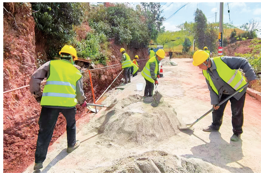
弥渡县宾街镇瓦哲村村民正在修建水渠。(摄于3月31日)

榆华社区依托“党建综合体”平台,探索“党建+治理”模式,资源共享、阵地共用,紧密团结辖区机关单位、企业、新业态群体等,凝聚共治合力。